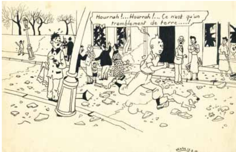
Bruxelles, 1950 d'après L'étoile mystérieuse, Hergé