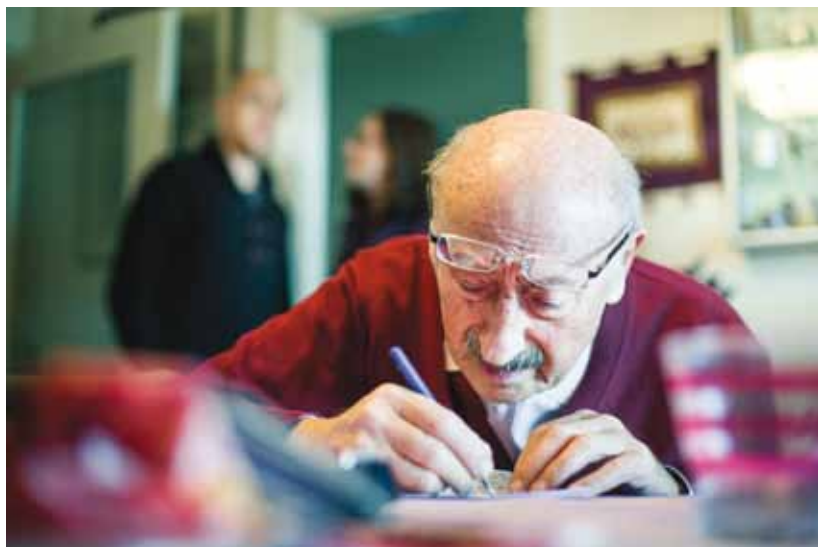
Bruxelles 2015