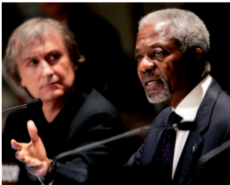
Plantu et Kofi Annan New York, siège des Nations Unies 16 octobre 2006 Conférence « Désapprendre l'intolérance »

Pour en savoir plus : www.cartooningforpeace.org et www.facebook.com/CartooningforPeace